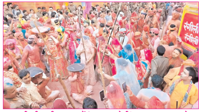
राधा रानी की नगरी बरसाना में 'लट्टमार होली' का हुआ भव्य आयोजन

* रजि. नंबर : 52290/90 * वर्ष : 36 * अंक : 274 * पृष्ठ : 12 * औरंगाबाद, सोमवार, 2 मार्च 2026 * मूल्य : 3.00 रुपये * औरंगाबाद, पटना एवं बोकारो से प्रकाशित * www.navbihartime.com